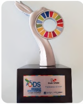
II Edición Reconocimiento a las Buenas Prácticas de Desarrollo Sostenible de las ODS

Hemos sido reconocidos con los siguientes premios internacionales: