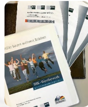
3er lugar Schüler bauen weltweit Brücken. Los colegios construyen puentes en el mundo